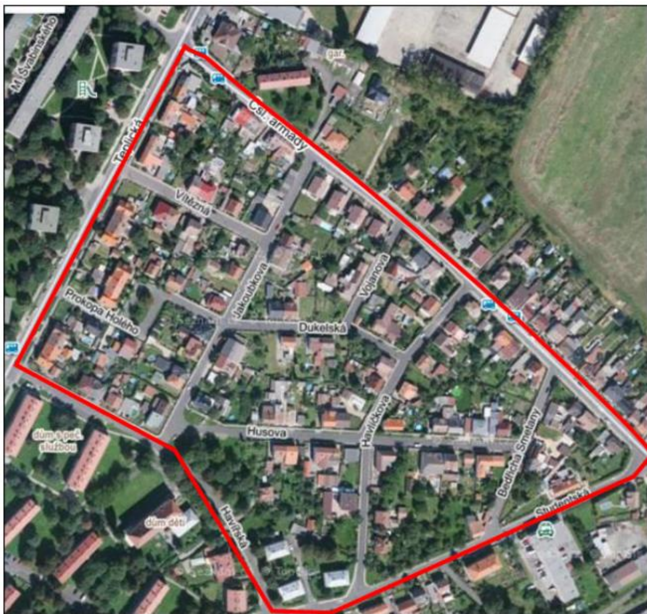
Příloha č. 1 – Situační náčrtek KN: