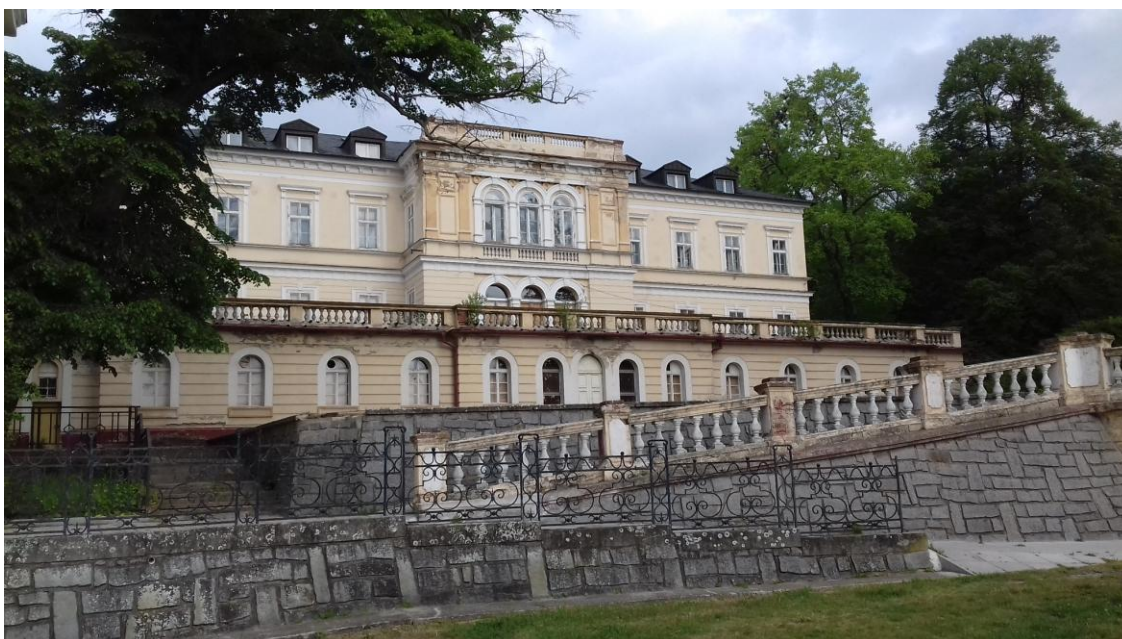
Celkový pohled na jihovýchodní průčelí objektu

Střešní krytina je skládaná z břidlicových šablon. Tato krytina je poměrně nová, rekonstrukce střechy proběhla v nedávné době. Střešní krytina je lokálně narušená, zejména v problematických místech napojení na čelní balustrádovou zeď. V detailech střechy v rozích dochází k zatékání srážkové vody do nosné dřevěné konstrukce krovu a dále pak do interiéru objektu.