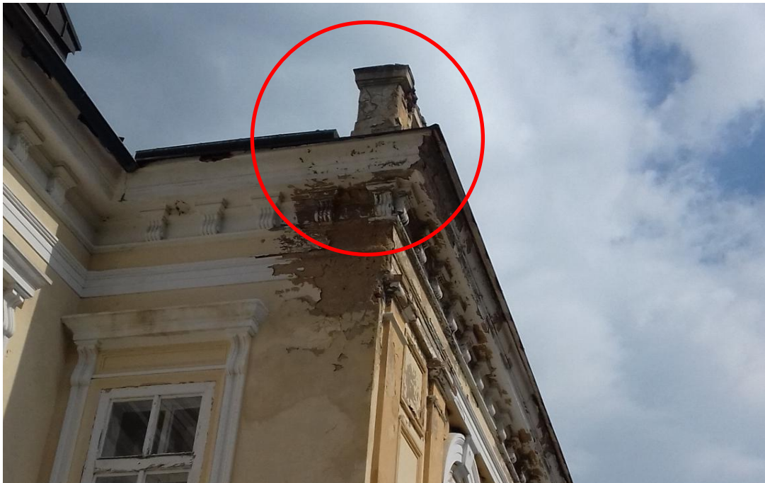
Degradace zdiva s označením místa zatékání srážkové vody do objektu

Je však nutné zabránit dalšímu vnikání srážkové vody do nosné konstrukce zdiva, aby nedocházelo k dalšímu zhoršování jeho stavu a nosné funkce.