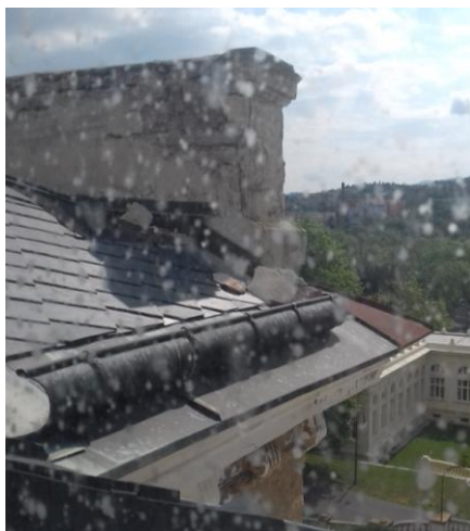
Roh střechy , kde dochází k zatékání do nosných konstrukcí

Stav dřevěných konstrukcí krovu je převážně dobrý. Prohlídkou nebyly zjištěny poruchy statického charakteru. Lze však předpokládat, že lokálně v místech zatékání srážkové vody je stav konstrukce horší. Jedná se především o čelní nároží jihovýchodní fasády v místech napojení krytiny na ozdobnou štítovou zeď. V těchto místech je nutné obnažení krytiny, kontrola nosných prvků krovu a popřípadě jejich částečná výměna. Dále pak úprava detailu odvodnění střechy.