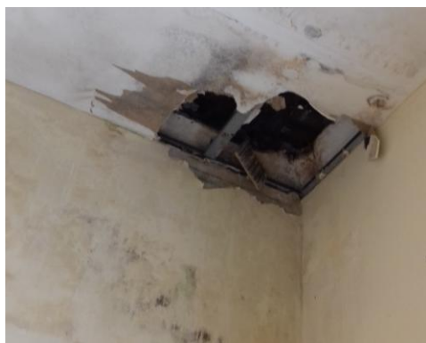
Lokální propad stropu nad 2.NP

Nosná konstrukce stropů nad prvním patrem je celkově v dobrém statickém stavu, lokální poruchy jsou snadno odstranitelné.